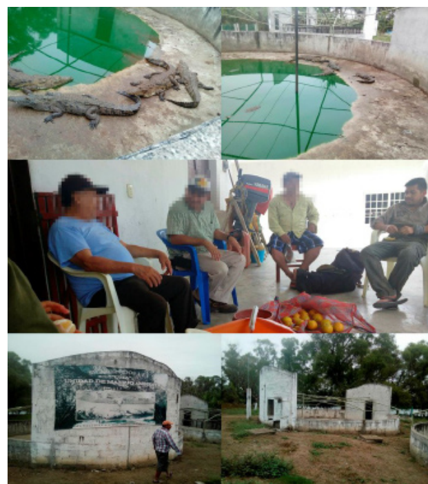
Figura 1. Instalaciones de UMA de crocodilianos que fracasó por abuso hacia la gente local.

Lo anterior es una situación alarmante debido a que pueden existir otras UMA con la misma situación, ya que algunas UMA se ubican