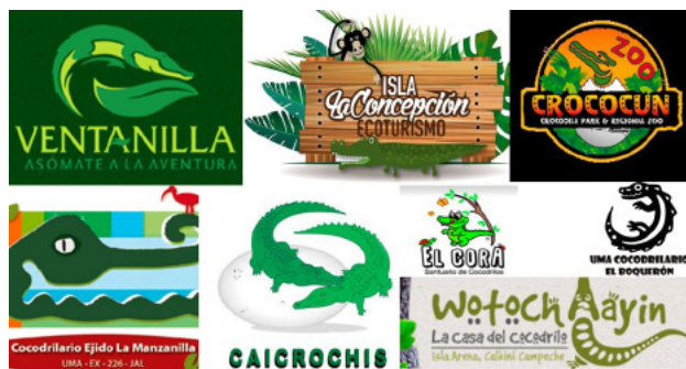
Figura 3. Ejemplo de grupos organizados que han adoptado a los cocodrilos como fuente de ingresos económicos, realizando programas de manejo y conservación de los mismos.