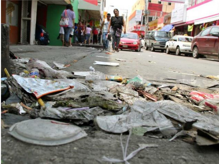
Imagen 7: Calle en el centro de la ciudad de Tuxtla Gutiérrez, Chiapas.