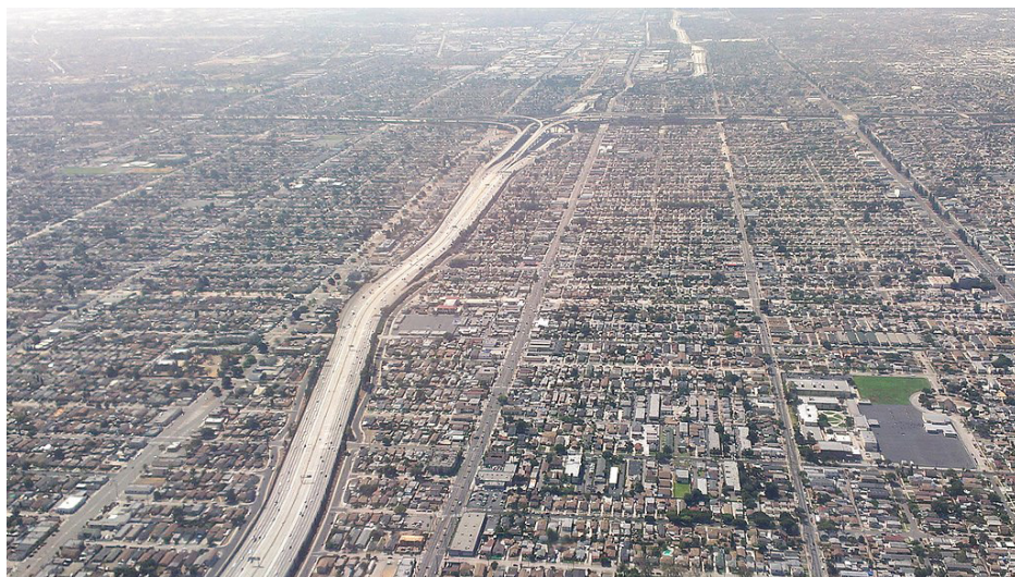
Imagen 5. Diseño arquitectónico de ciudad estilo “ajedrez” en el Vermont Square al sur de Los Ángeles.