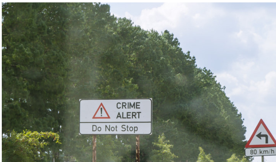
Imagen 4. Letreros alusivos a las zonas criminales en ciudades de Sudáfrica. (Paula & Andrea, 2018).