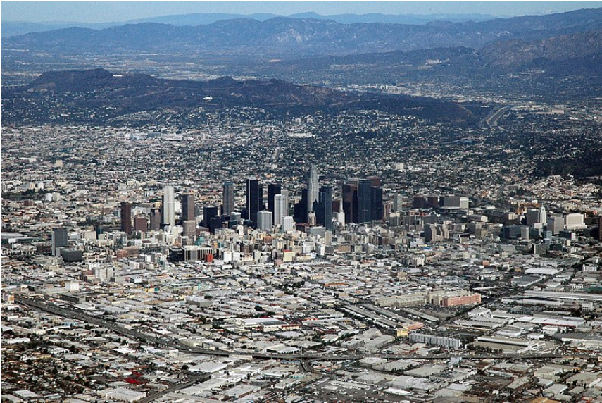
Imagen 3. Downtown, Los Ángeles. (Marshall, 2007).