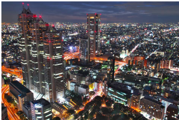
Imagen 2. Shibuya scramble square en Tokio. (Go Tokyo, 2023).